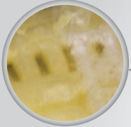
Sellado de alta frecuencia.